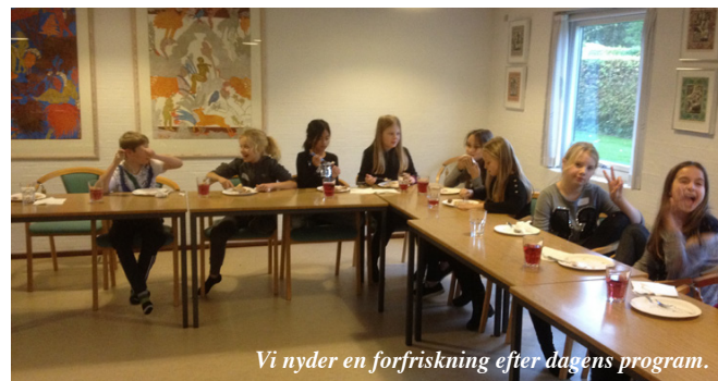
Vi nyder en forfriskning efter dagens program.