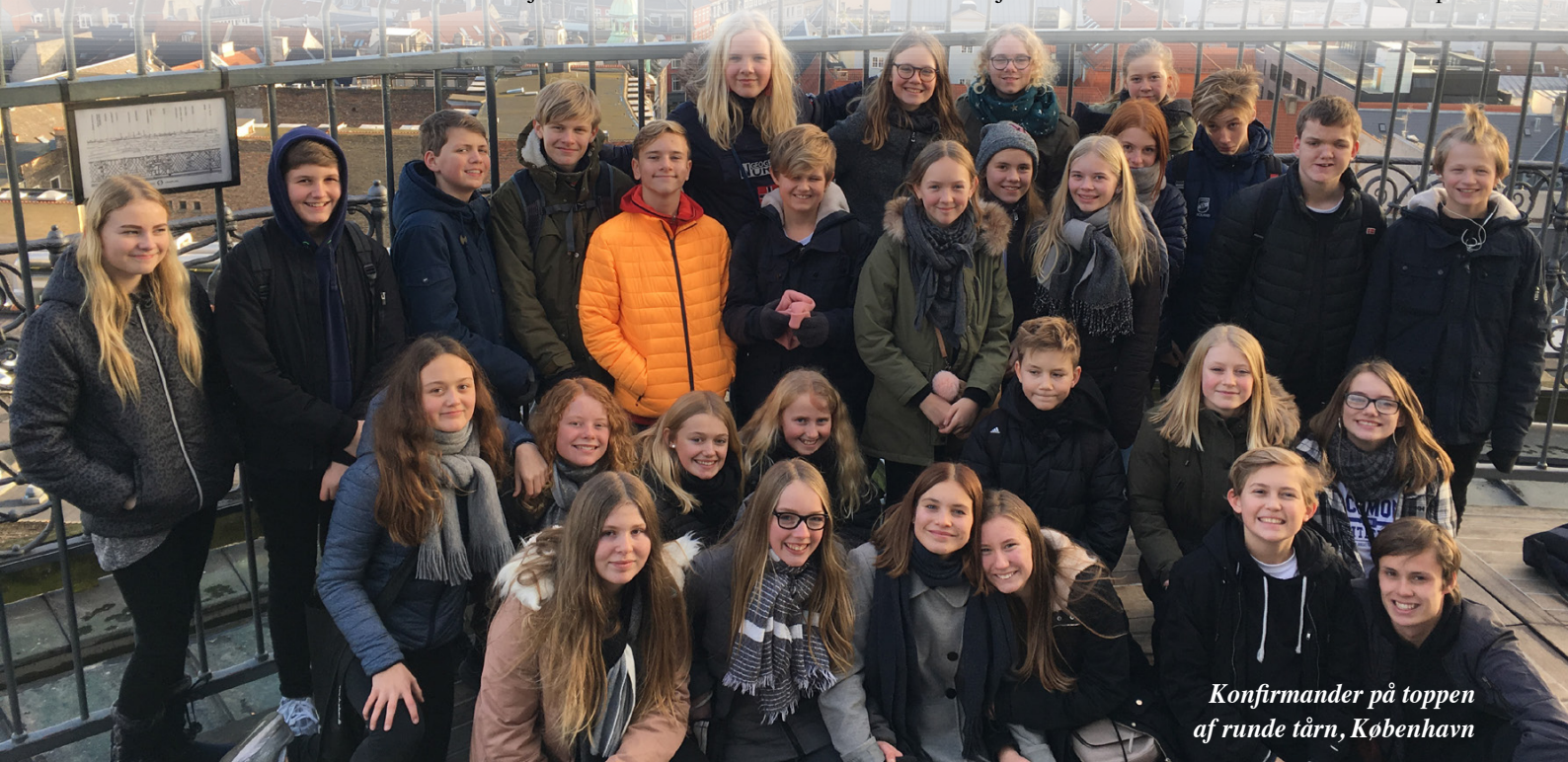
Konfirmander på toppen af runde tårn, København

Fangel Kirke: 30. april Stenløse Kirke: A-klassen 18. april B-klassen 25. april