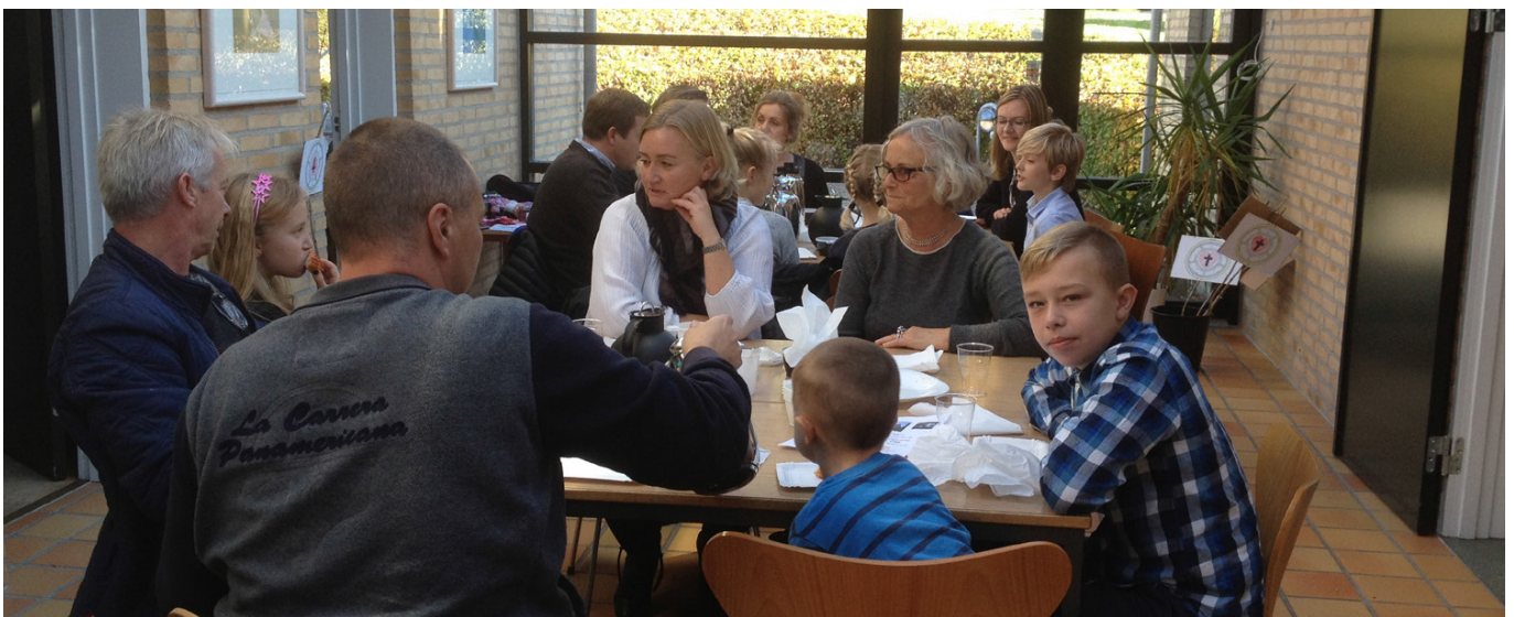
Foto fra kaffe og brød efter BUSK-gudstjenesten i oktober 2017. En dejlig formiddag, hvor vi sad i sal og glasgang og hyggede os efter gudstjenesten. Tak for god opbakning! Og velkommen alle sammen til børnegudstjeneste d. 17. maj.